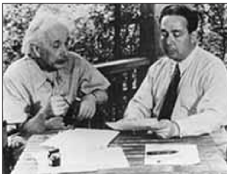
Albert Einstein och Leo Szilard skriver ett brev till president Roosevelt 1939.

Källa: http://www.sime.com/neue_galerie/jvk/04.html